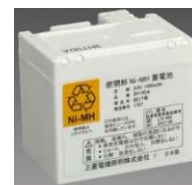
写真1. 蓄電池外観例

なお、お客様の設置場所や用途にて全数の点検が困難であるなどの事情がございましたら、点検を実施せず、対象蓄電池の全数交換をさせていただきたく所存です。